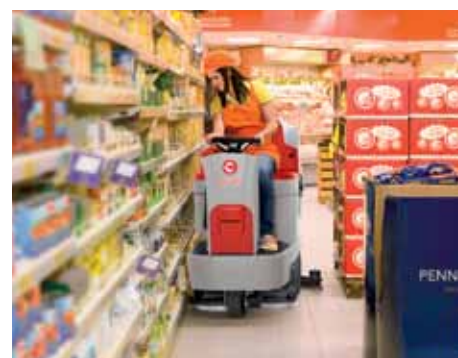
Facile sostituzione delle gomme senza l'utilizzo di utensili sull'esclusivo tergilavaggio Comac (Patent Pending)