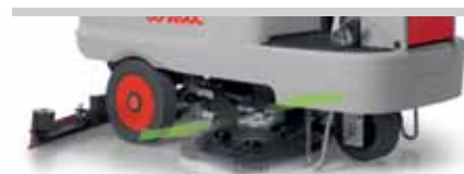
Innova 70 S

Innova 65/75/85 adottano di serie un sistema che permette di regolare la pista di lavoro da 65 a 85 cm (per maggiori informazioni contattare il servizio assistenza Comac)