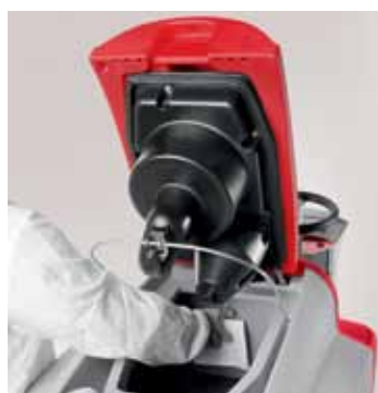
Completa sanificazione dei serbatoi

Facile nella ricarica delle batterie grazie alla possibilità di avere il caricabatterie a bordo (su richiesta)