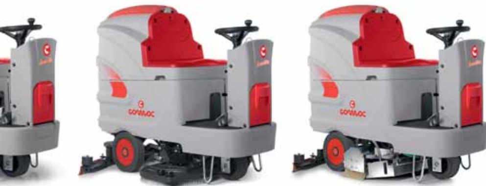
Innova 100 B

Un semplice dispositivo (optional) permette di riempire velocemente il serbatoio dell'acqua pulita senza la presenza dell'operatore