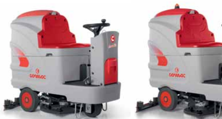
Innova 60 B