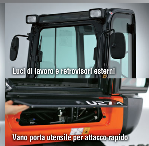
Luci di lavoro e retrovisori esterni