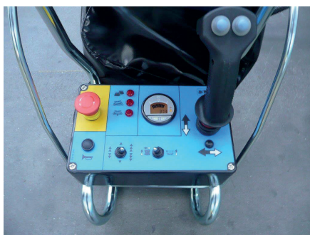
Quadro comandi sulla piattaforma semplice e intuitivo