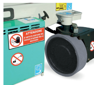
Sterzo idraulico a 90°