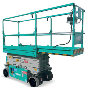
Estensione manuale piattaforma 1 m