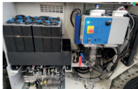
Quadro di comando e gruppo batterie principale