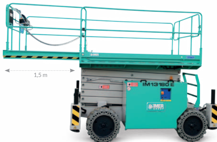
Estensione manuale della piattaforma di 1,5 m per una lunghezza complessiva di 4,2 m