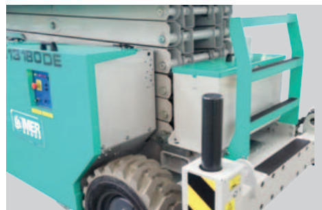
Secondo gruppo batterie esterno per versione DE