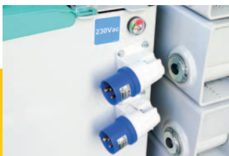
Gruppo spina caricabatterie e spina per alimentazione in cеста con indicatore livello batterie (versioni E e DE)