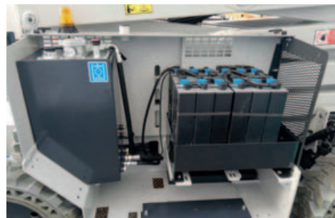
Secondo gruppo batterie e deposito olio