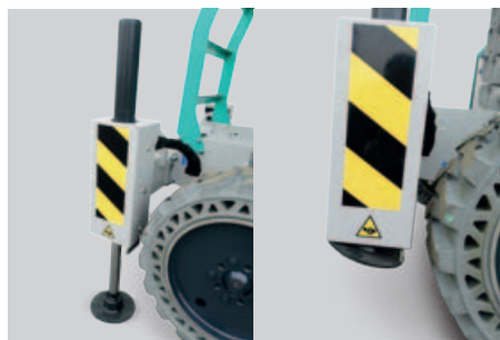
Sistema di stabilizzazione idraulica automatica