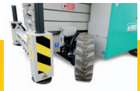
Angolo di sterzata ridotto grazie all'inclinazione ruote di 70°