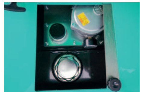
Sportello apribile per riempimento carburante senza necessità di aprire il cofano laterale