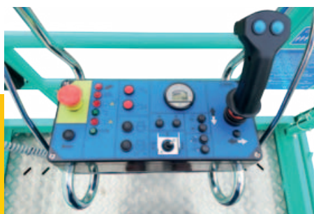
Quadro di comando semplice e intuitivo asportabile dalla navicella per carico/scarico della macchina