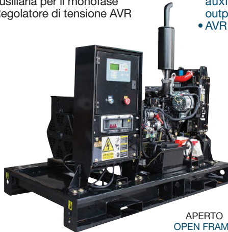
APERTO OPEN FRAME