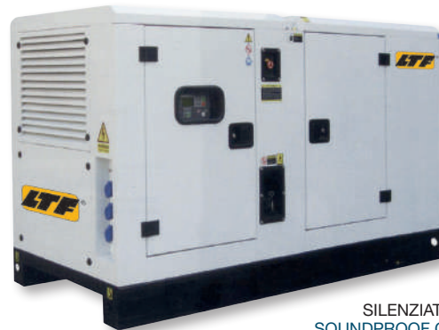
SILENZIATO SOUNDPROOF CANOPY